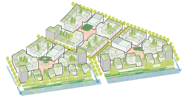
Siegerentwurf von asp Architekten zum Teilgebiet B